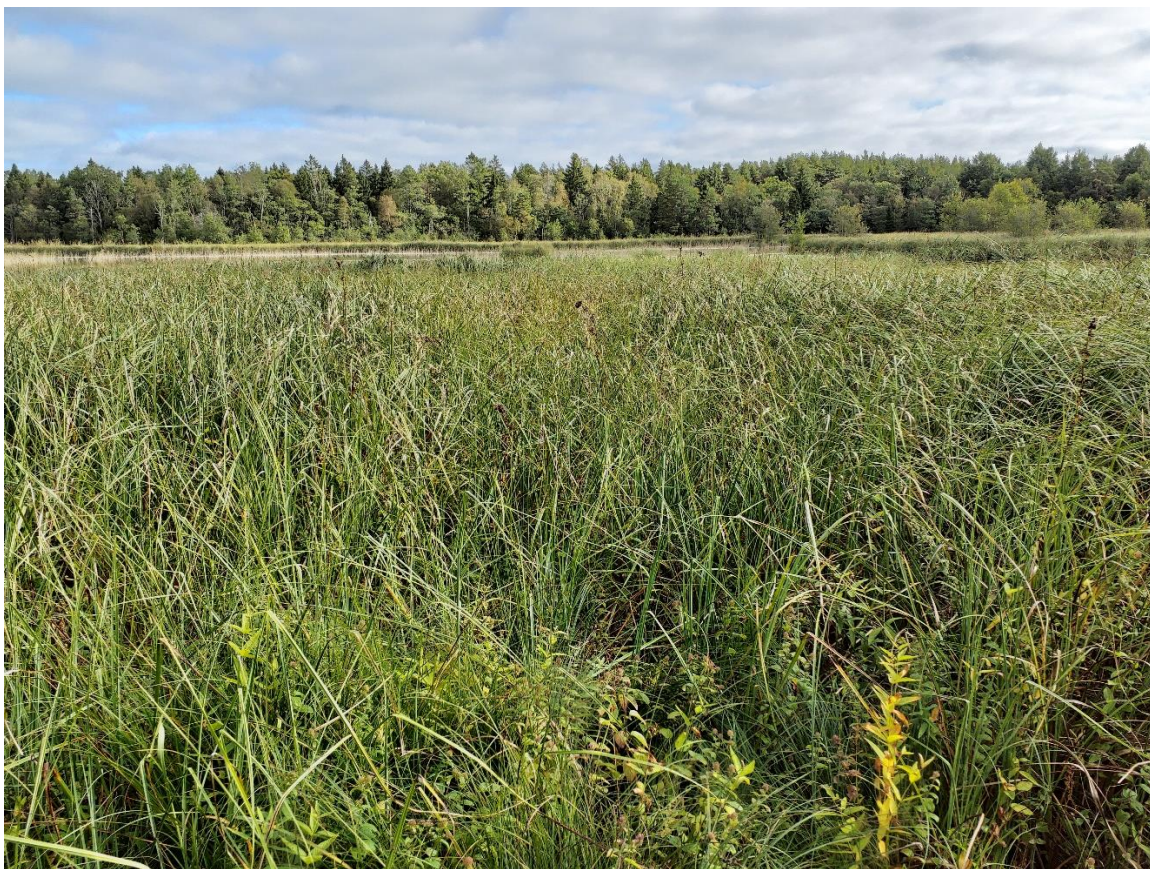
Joonis 3. 19.09.24 Laibu lahe taimestunud väljavool. Taamal paistab lahe vabaveeline osa.