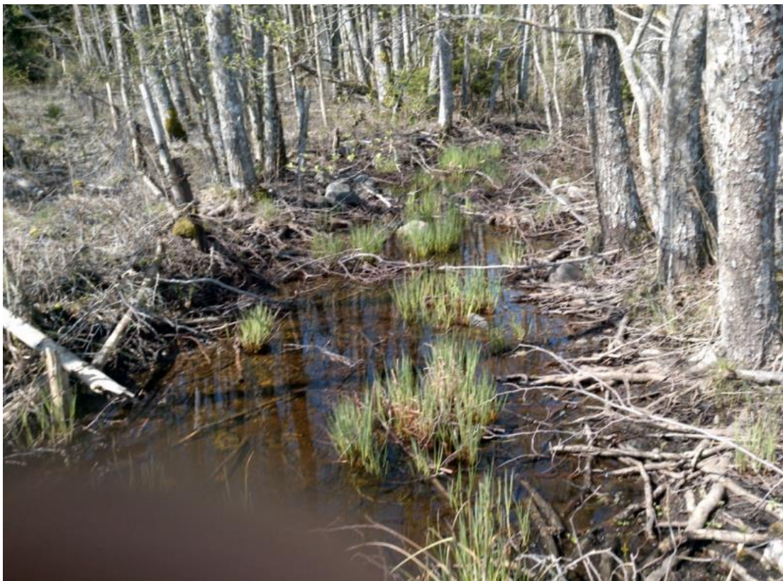
Joonis 4. Kiissa oja Laibu lahe väljavoolul 11.05.2022.