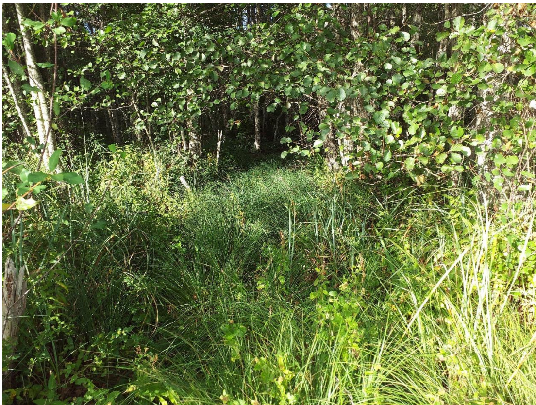
Joonis 5. Kiissa oja Laibu lahe väljavoolul 19.09.24 (Autor: Anett Reilent).