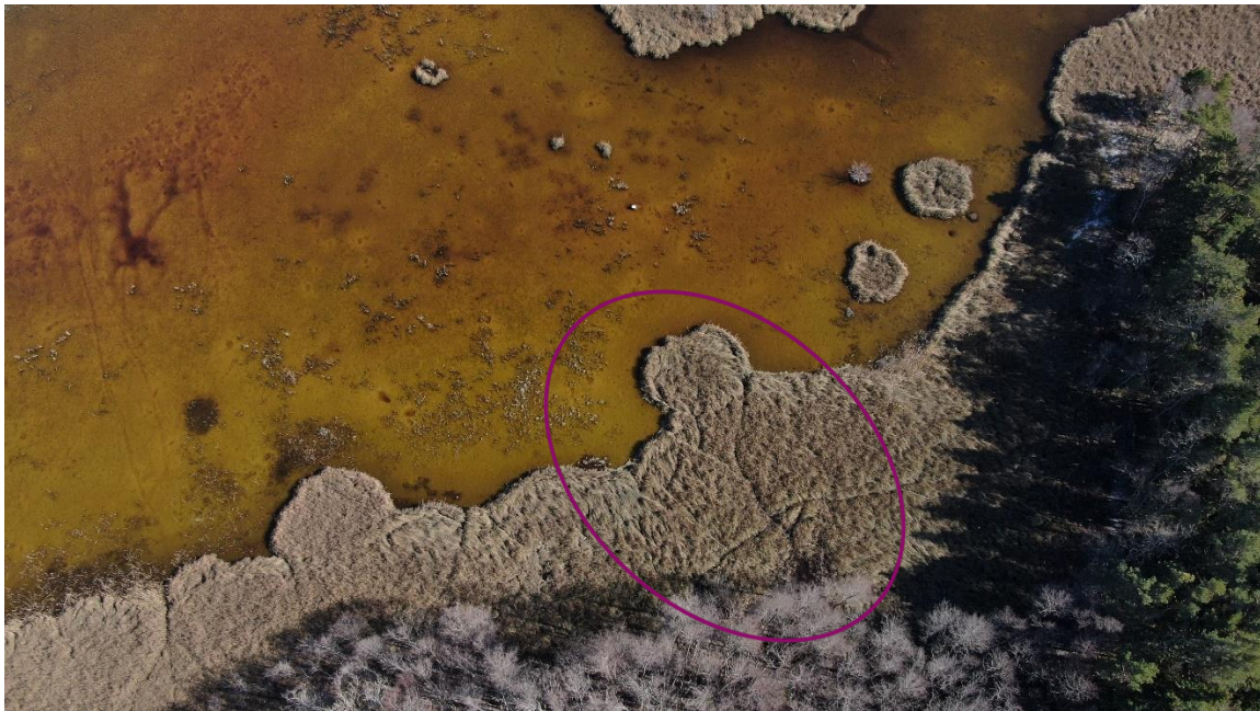
Joonis 2. Droonifoto kinnikasvanud, aga nähtavast harunevast Kiissa jõe sängist (roosa ovaal).